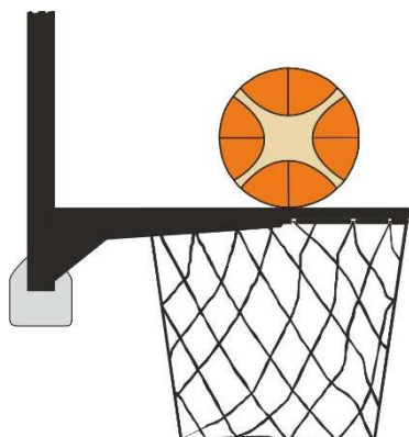
Obrázek 2 Míč v kontaktu s obroučkou

31 - 15 Ustanovení. Srážení míče nastává, když se během hodu na koš z pole obránce nebo útočník dotkne desky nebo koše, zatímco je míč v dotyku s obroučkou a má možnost padnout do koše.