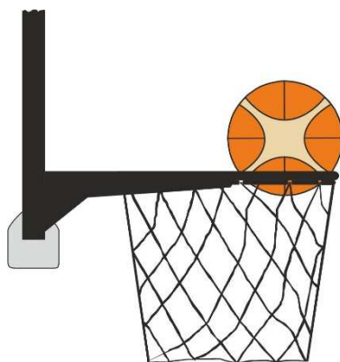
Obrázek 3 Míč v koši

31 - 20 Ustanovení. Jestliže se bránící hráč dotkne míče, který je v koši, je to přestupek.