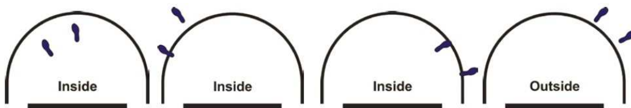
Obrázek 4 Postavení hráče uvnitř/vně území půlkruhu proti prorážení